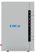
1 Router wifi