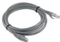
2 Cable Ethernet