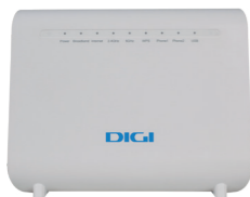
1 Router wifi