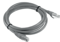
2 Cable Ethernet