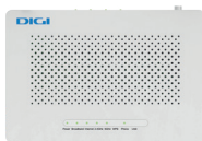
1 Router wifi